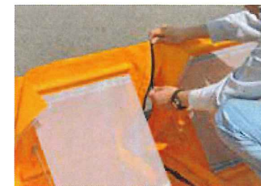
接続用ファスナーを閉める