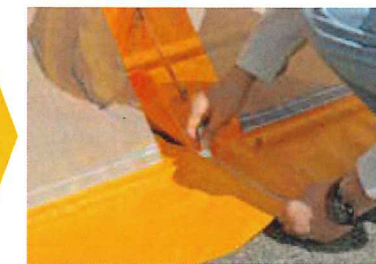
止水用ファスナーを閉める